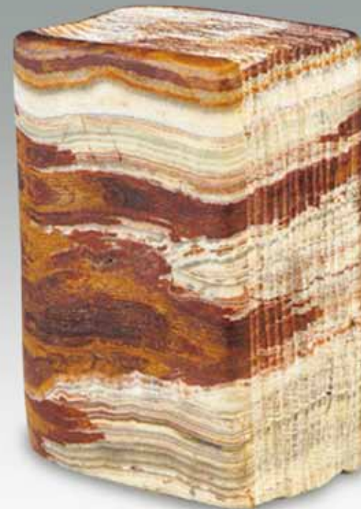
クーパッハ・ヴィルムゼン「Stone Book」 H:14.8×W:10.5×7cm 石彫(化石サンゴ)